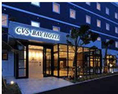
CVS・BAY HOTEL 本館

○2018年4月開始のアニメ 『イナズマイレブン アレスの天秤』 《普通のお部屋》で実施！